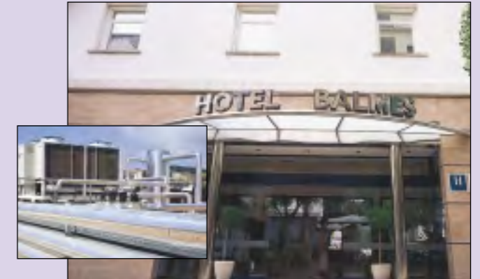
Hotel Balmes *** (Calella) Climatització