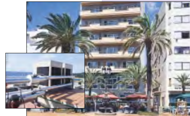
Hotel Excelsior *** (Lloret de Mar) Climatització