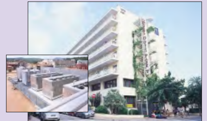
Hotel Oasis Park *** (Lloret de Mar) Climatització