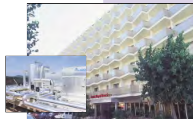
Hotel Royal Beach *** (Lloret de Mar) Climatització