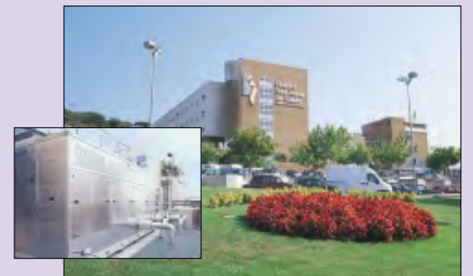
Hospital de Calella (Calella) Climatització