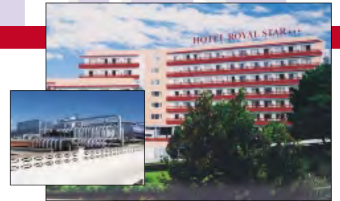
Hotel Royal Star *** (Lloret de Mar) Climatització