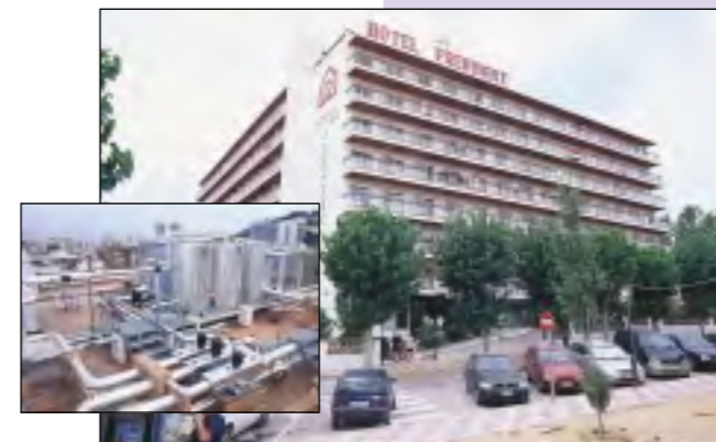
Hotel President *** (Calella) Climatització