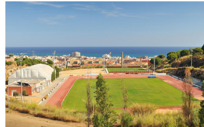
Vista de la zona esportiva de La Muntanyeta.