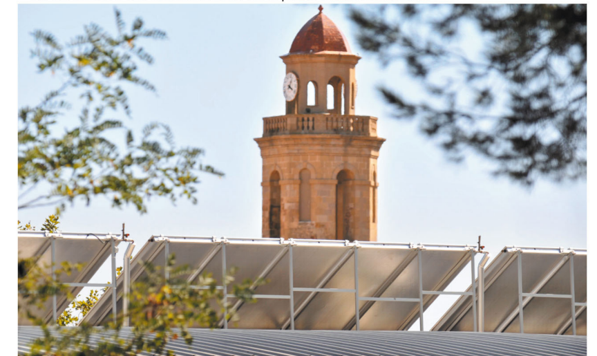
Detall de la instal·lació solar del Pavelló Municipal d'Esports.